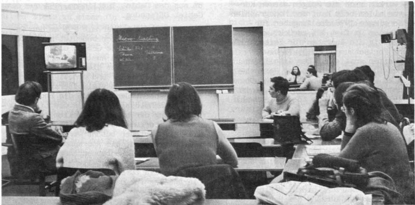
Die Besuchergruppe im Micro-Teaching-Raum