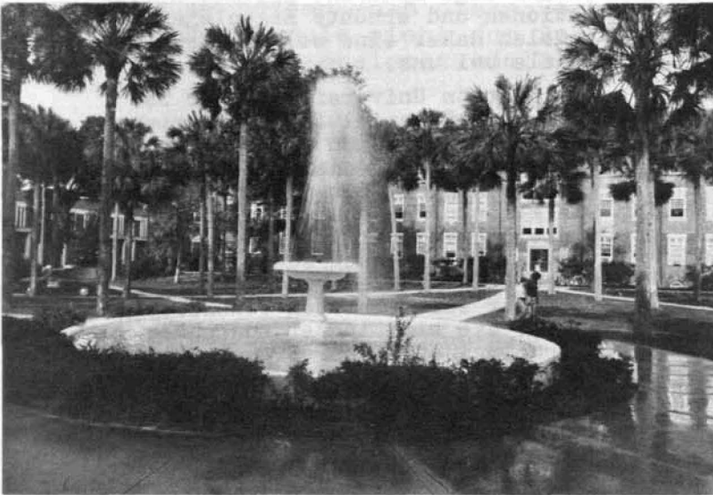
Innenhof der Stetson University, DeLand

ganzes Semester, um sich in der neuen Umgebung einzuarbeiten und mit allen Bestimmungen und Gepflogenheiten vertraut zu werden. Erst in den weiteren Semestern hat man genügend Abstand um über sein unmittelbares Arbeitsfeld hinauszusehen und an den gesellschaftlichen Anlässen stärker Anteil zu nehmen. Schließlich hätten sich in kürzerer Zeit kaum so gute und fundierte Kontakte herstellen lassen, Kontakte, die wir nicht nur privat, sondern auch im Interesse der Hochschule zu pflegen bereit sind.