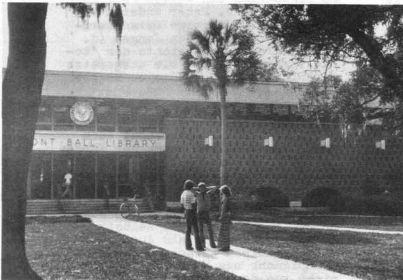
Vor der Bibliothek der Stetson University